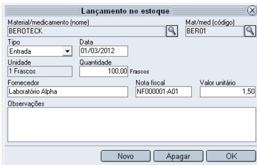
Figura 2 - Imagem da tela do software apresentado pelo administrador.